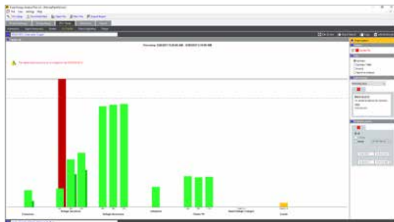
Fluke Energy Analyze Plus: Resumo do estado de saúde da qualidade da potência